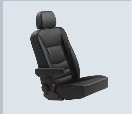
Optionaler XL Komfortsitz